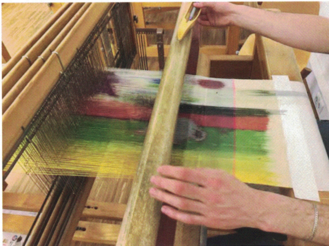
Kettmalerei am Webstuhl, 2024