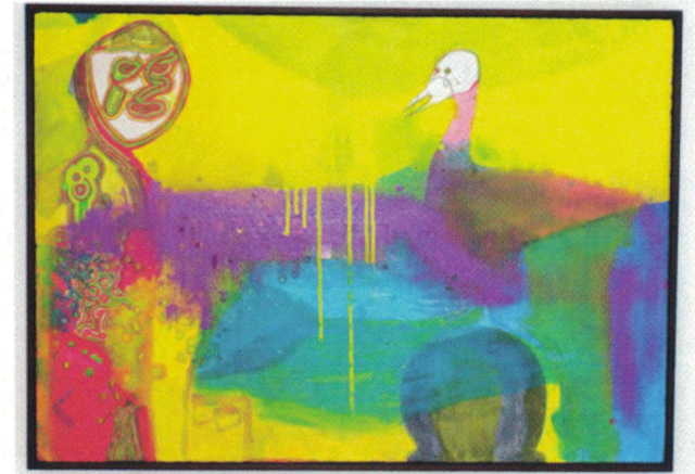
Untitled (Gil), 2024

Zu Motiv, Material, und Farbe greifen wir intuitiv und laden den Zufall dazu ein. Happy little accidents entstehen.