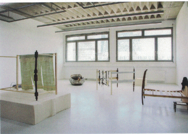
Vanessa Schmidt, Beds, Scenes and Notes , 2022

Ein ruhiger Schlaf belebt, Schlaflosigkeit und Alpträume sind lähmend und erschöpfen. Die unvollständigen Bettskulpturen auf die sich keiner legen kann, dienen als Display für textile Träume, Texte und Texturen.